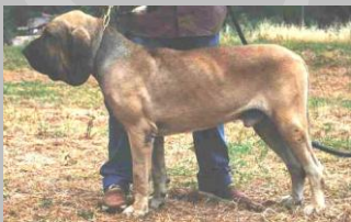
Figura 15 Luxsor do lineamento Engenho

Buona chiusura a forbice , dentatura corretta , eccellente tipicità , testa eccellente , eccellente il cranio, eccellente occipite, stop corretto , solco mediano frontale un po' accentuato con una formazione di pliche e rughe a riposo , lieve eccesso di labro superiore ed inferiore, espressione tipica della razza , muso corretto buon tartufo, ottimo l'occhio per colore e forma , buone le orecchie con attaccatura larga un po' piegate ma ben portate con posizione bassa a riposo e portate dietro l'occipite , giogaia buona ma un po' eccessiva , angolazioni anteriori e posteriori corrette , linea superiore buona , linea inferiore buona , buoni i fianchi , buona la spalla ,buona l'ossatura anteriore e posteriore , coda larga alla base , si evidenzia una eccellente dimorfismo sessuale , Passo in ambio , trotto tipico che evidenzia correttezza generale e strutturale.