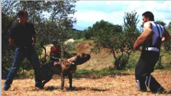
Figura 14 Bonarda dell'Umbriaco

Dentatura con incisivi non ben allineati, chiusura a forbice espressione truce non tipica della razza , tipicità scarsa , scarsa testa nell'insieme non tipica e corta , muso poco pieno ,occhio rotondo e troppo chiari rispetto al mantello , buon solco frontale , orecchio sufficiente giogaia scarsa non ben definita , costruzione con torace un po' piatto nella parte inferiore linea superiore con leggero avvallamento coda ben larga nell'inserzione forte ossatura buon sviluppo muscolare passo in ambio groppa corta coda inserita alta, al trotto si evidenzia una lieve zoppia .