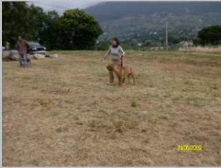
Figura 12 Dreher Dell' Umbriaco