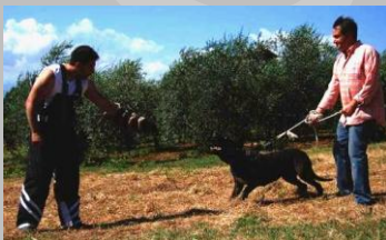
Figura 13 Scurançà 2 Yaspica

Buon tipo testa ben evidenziata cranio ben largo con solco frontale eccessivo muso pieno nelle due dimensioni tartufo largo buona la rima labiale , espressione truce non tipico del fila che presenta una espressione più dolce orecchie ben inserite ,giogaia non ben definita con poca pelle , costruzione con buon sviluppo toracico leggero avvallamento della linea superiore coda inserita alta ma sufficientemente larga , posteriore debole, groppa corta scarsa muscolatura con angoli aperti e baricentro spostato in avanti, appiombi anteriori deboli che gli fanno perdere stabilità anteriormente , passo in ambio al trotto denota debolezze generali , poca spinta