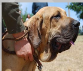
Figura 8 Gerais de las contiendas (Kibo)

PRIMO MOLTO BUONO : tipo eccellente ottima testa per rapporti e forma cranio di buon profilo con stop e occipitale corretti , muso pieno sia in profondità che in grandezza , tartufo pieno occhi inseriti in modo eccellente ogiva rotonda occhio a mandorla pliche facciali buone orecchio ben inserito e portato giogaia corretta , buona ossatura buone le angolazioni sia posteriori che anteriori coda portata bene e ben larga alla radice denota una buona ossatura . Soggetto con ampio margine di miglioramento