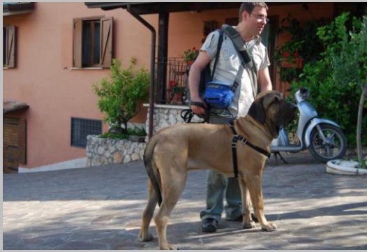
Figura 4 Aniello e Boris