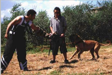
Figura 16 Nhambù de el Siledin

Chiusura a tenaglia ( ammessa ma non preferibile) incisivi inferiori consumati testa un po' pesante con espressione mastinoide , cranio largo , muso pieno ma pesante , disegno labbra un po' mastiff , non si evidenzia la commensura labiale , occhio non a mandorla, buone pliche facciali , cranio largo con solco mediano troppo marcato con rughe sul cranio ,orecchie larghe alla base inserite un po' alte , costruzione buona, torace profondo ma piatto , linea superiore leggermente avvallate e dopo il garrese leggermente cifotica , goppa corta con coda attaccata alta ma sufficientemente larga , ossatura leggera , muscolatura e angolazioni insufficienti , spalla aperta , posteriore scarsa muscolatura , metatarso ben lungo piedi posteriori e anteriori buoni passo in ambio buono trotto sufficientemente corretto ma apatico