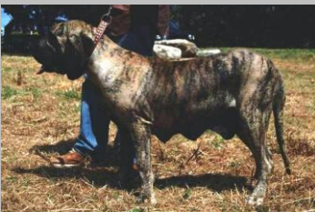
Figura 10 Insinha lineamento Engenho

Dentatura corretta ottima tipicità molto espressiva, muso pieno, buon occhio ,tartufo grande ,orecchie e coda buone, pliche facciali ottime, ottimo disegno del labbro superiore ed inferiore, buona giogaia, costruzione ben sviluppata linea superiore un po' insellata (probabilmente per la recente cucciolata ) ottimo posteriore, ottime angolazioni e muscolatura ,buoni piedi ,buona spalla, buona tigratura molto larga con partenza a spina di pesce dalla linea superiora muove correttamente in ambio, ottimo movimento al trotto molto tipico dinocolato con ottimo giogo di spalle e garretti