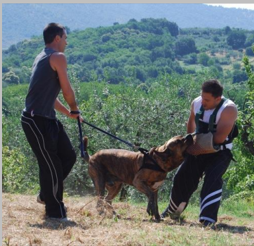
Figura 17 Carioca dell' Umbriaco

Chiusura a forbice espressione non tipica , testa mastinoide , cranio molto rotondo, stop accentuato ,occhio chiuso tipo mastino, muso poco profondo, i labbri superiori sono insufficienti, eccesso rughe attaccate alte , giogaia non definita , costruzione pesante, torace piatto ma ben disceso , angoli anteriori aperti , forte ossatura linea superiore leggermente cifotica a causa dei fianchi corti e l'errata angolazione della goppa che risulta essere corta e alta , buona la muscolatura anteriore e posteriore , appiombi anteriori scorretti ( radio curvo) , evidente meticciamiento , passo in ambio , al trotto accentua l'arrotolamento della coda sulla goppa a causa della errata angolazione della goppa